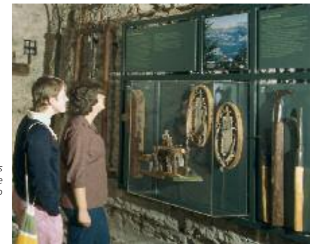
Im kleinen Museum auf Entdeckung aus A la découverte d'un petit musée Alla scoperta del piccolo museo

Die Chancen des kleinen Museums heute Les chances des petits musées de nos jours Le opportunità del piccolo museo oggi