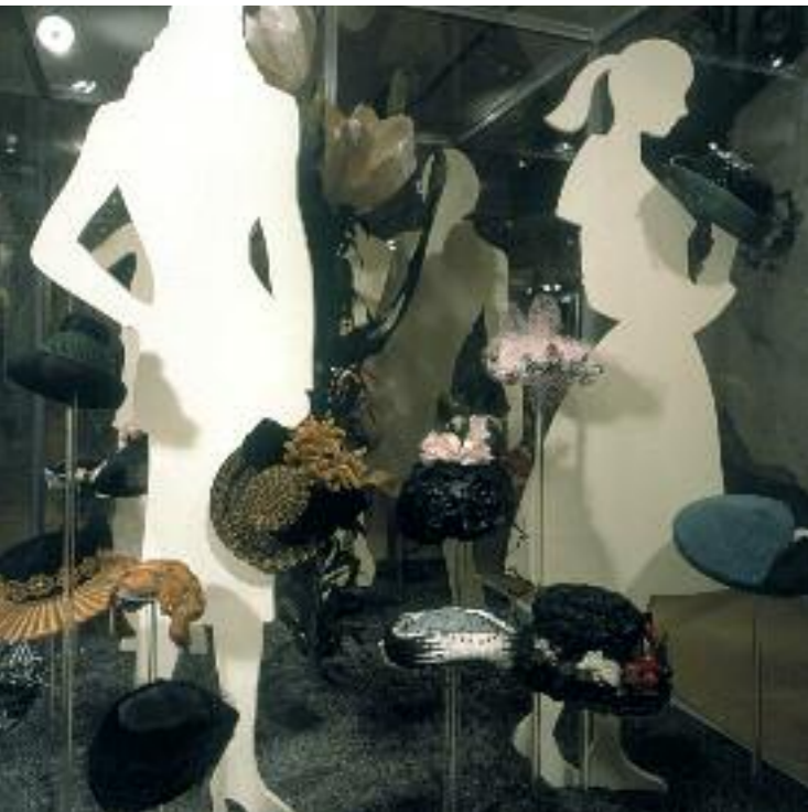
Hüte für die Dame, Silhouetten für die Modeströmung Chapeaux pour Madame, mannequins pour la mode de l'époque Cappelli per signore, silhouette per l'epoca della moda